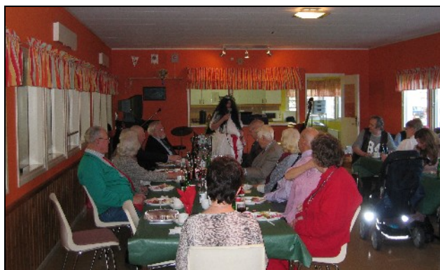
Den missförstådda Lucian