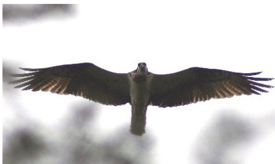
Fiskgjuse utrotningshotad av Golf of Course

Kommunfullmäktige beslutade i juni med 37 röster för, 10 emot och 2 nedlagda att detaljplan upprättas för projektet. Mot beslutet reserverade sig kommunpartiet skriftligen.