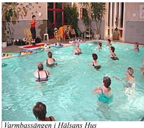
Varmbassängen i Hälsans Hus

alldeles klart att HSN7 nonchalerar det behov som finns i kommunen och fortsätter förhindra att Härrydas medborgare får tillgång till det som andra kommuner tillhandahåller.